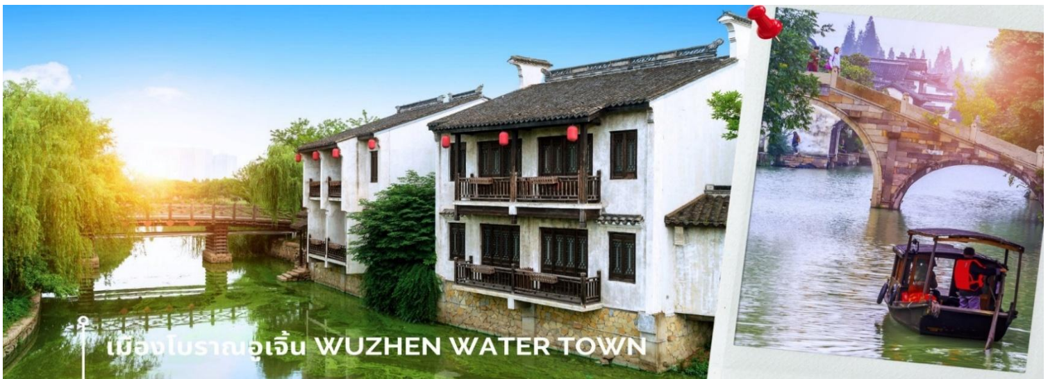
เมืองโบราณอู่เจิ้น WUZHEN WATER TOWN

นำท่าน แวะร้านบัวหิมะ ซื้อสมุนไพรที่มีชื่อดัง ในด้านบรรเทาอาการแพ้ไฟไหม้ น้ำร้อนลวกดีนัก จากนั้นนำท่านเดินเล่น ย่านเมืองเก่า เมืองโบราณอู่เจิ้น ตั้งอยู่ทางตอนเหนือของเมืองฉงชิ่ง มีจุดเด่นคือการเป็นเมืองที่ถูกล้อมรอบไปด้วย