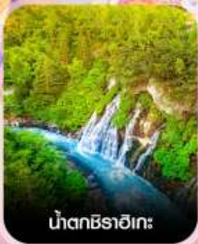
น้ำตกชิราอิเกะ