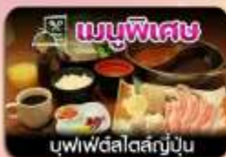
บุฟเฟ่ต์สไตล์ญี่ปุ่น

ชิบโปโร-ชมทุ่งดอกลาเวนเดอร์-โทมิตะฟาร์ม-ซิกิไซโนะโอะกะ-น้ำตกชิราอิเกะ-บ่อน้ำสีฟ้า-อิสระช้อปปิ้งเต็มวัน-พักออนเซน