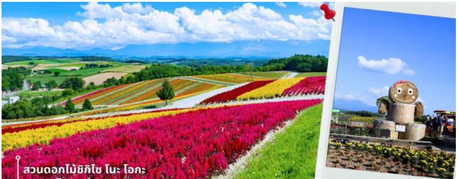
สวนดอกไม้ชิกิไซ โนะ โอะกะ

หลังรับประทานอาหารเช้า นำท่านเดินทางสู่ สวนดอกไม้ชิกิไซ โนะ โอะกะ ชื่อเต็มๆว่า Panoramic Flower Gardens Shikisai No Oka ซึ่งในช่วงซัมเมอร์จะเป็นเนินเขาสีสันสดใสกว้างสุดสายตา พื้นที่กว่า 15 เฮกตาร์ หรือประมาณ 93 ไร่ เป็นสถานที่ที่ได้ชื่อว่า มีความสวยงามทั้ง 4 ฤดู ที่สวนแห่งนี้จะมีดอกไม้หลากหลายสายพันธุ์ ทั้ง ลาเวนเดอร์ ทิวลิป โคเคีย ทานตะวัน และอื่นๆ มากกว่า 30 ชนิดที่สลับกันไปตามฤดูกาล อย่างในช่วงซัมเมอร์ คือ