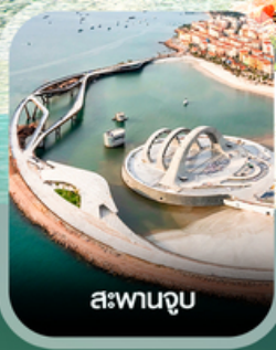
สะพานจูป