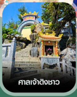
ศาลเจ้าดิ้งซาอว