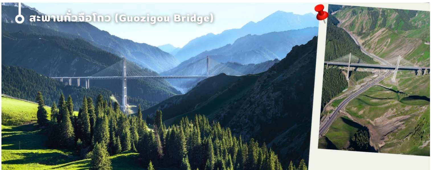
○ สะพานกัวจื่อโกว (Guozigou Bridge)

จากนั้นนำทุกท่านเดินทางไปยัง เมืองอีหนิง (Yining) เมืองหลวงของเขตปกครองตนเองอีลีคาซัค ในซินเจียง ทางตะวันตกเฉียงเหนือของจีน เป็นศูนย์กลางวัฒนธรรมที่มีความหลากหลายทางชาติพันธุ์ โดยเฉพาะชาวอุยกูร์และชาวคาซัค เมืองนี้มีชื่อเสียงด้านทิวทัศน์และธรรมชาติที่สวยงาม เช่น ทุ่งลาเวนเดอร์กว้างใหญ่ พร้อมเสน่ห์ของดนตรีพื้นเมืองและวิถีชีวิตท้องถิ่น อีกทั้งที่นี่ยังเป็นหนึ่งในจุดหมายสำคัญบนเส้นทางสายไหม ที่นักเดินทางทั่วโลกจะได้สัมผัสทั้งธรรมชาติและวัฒนธรรมในทีเดียว ระหว่างทางนำทุกท่าน ผ่านชม สะพานกัวจื่อโกว (Guozigou Bridge) สะพานขนาดใหญ่ที่ทอดข้ามหุบเขาในเขตซินเจียง หนึ่งในแลนด์มาร์คสำคัญบนเส้นทางสาย G30 ได้รับฉายาว่า “ประตูสู่เทือกเขาเทียนชาน” ระหว่างทางท่านจะได้ชมวิวสะพานที่ทอดยาวท่ามกลางภูเขาและหุบเขาอันงดงามตระการตา ใช้เวลาเดินทางโดยประมาณ 2.5 ชั่วโมง