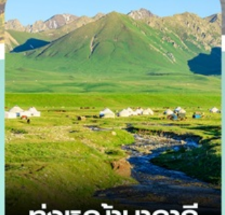
ทุ่งหญ้านาลาถิ