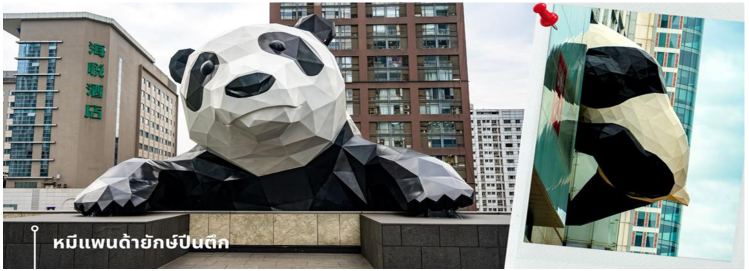
หมีแพนด้ายักษ์ปักกิ่ง