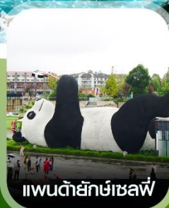
แพนด้ายักษ์เซลฟ์

✈️ คอนเฟิร์ม ออกเดินทาง ทุกพีเรียด 2 ท่านขึ้นไป