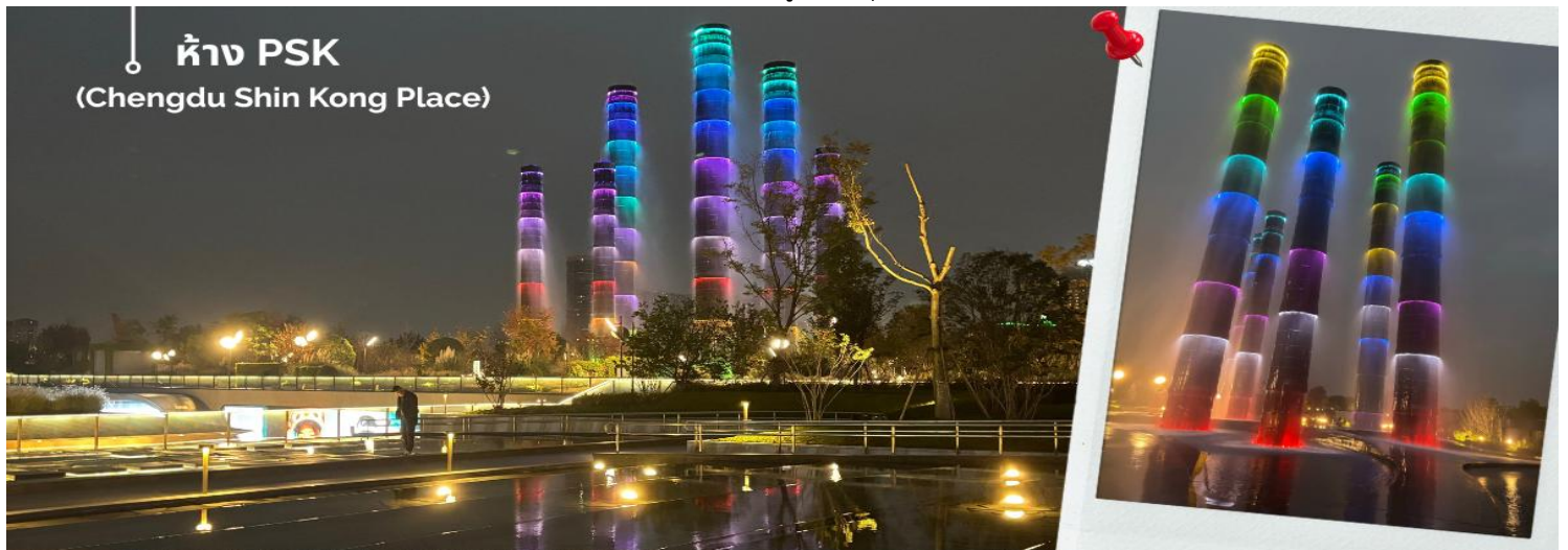
ห้าง PSK (Chengdu Shin Kong Place)

นำท่านเดินทางสู่ Global Center แลนด์มาร์กยักษ์ของเมืองเฉิงตูที่ขึ้นชื่อว่าเป็นหนึ่งในอาคารที่มีขนาดใหญ่ที่สุดในโลก ภายใน ศูนย์การค้าแห่งนี้ครบครันทั้งช้อปปิ้งแบรนด์ดัง โรงแรม ศูนย์ประชุม โรงภาพยนตร์ อีกหนึ่งจุดไฮไลท์ที่ไม่ควรพลาดเมื่อมาเยือนศูนย์การค้า Global Center คือ น้ำพุไม้ไฟ การออกแบบสุดสร้างสรรค์ที่ผสมผสาน ความงดงามของธรรมชาติกับศิลปะสมัยใหม่ น้ำพุแห่งนี้สร้างขึ้นในรูปทรง “กอไผ่” อันเป็นสัญลักษณ์ของความสงบและความ รุ่งเรืองของชาวเสฉวน เมื่อเปิดการแสดง น้ำจะพุ่งขึ้นสู่ท้องฟ้าพร้อมแสงไฟหลากสี สร้างบรรยากาศตระการตา และโรแมนติก เหมาะสำหรับการถ่ายรูปและพักผ่อนหย่อนใจหลังจากการช้อปปิ้งในศูนย์การค้าอันยิ่งใหญ่แห่งนี้ ปิดท้ายด้วยการชมไฟ ตึกแฝดเฉิงตูสัญลักษณ์แห่งความทันสมัยของเมืองเฉิงตู ตั้งอยู่ย่านศูนย์กลางการเงิน Tianfu New Area ตึก แฝดสูงเสียดฟ้านี้เป็นที่ทำงานของบริษัทชั้นนำและศูนย์การประชุมขนาดใหญ่ ยามค่ำคืนบริเวณนี้จะสวยงามเป็นพิเศษ เมื่อมีการจัด แสดงแสงไฟ Light Show ส่องประกายบนตัวอาคาร กลายเป็นจุดถ่ายรูปยอดนิยมที่สะท้อนภาพความเจริญและความล้ำสมัยของ เฉิงตูในปัจจุบัน