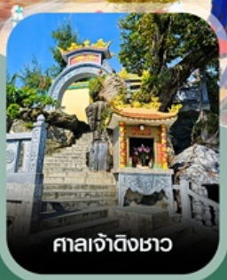
ศาลเจ้าดิ้งซาอว