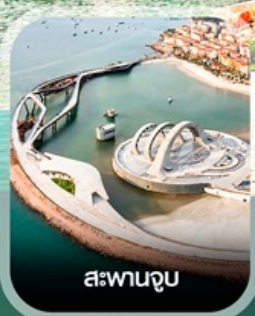
สะพานจูป

✈️ คอนเฟิร์มออกเดินทาง ทุกพีเรียด 2 ท่านขึ้นไป