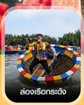
ล่องเรือกระดิ่ง

✈️ คอนเฟิร์มออกเดินทาง ทุกพีเรียด 2 ท่านขึ้นไป