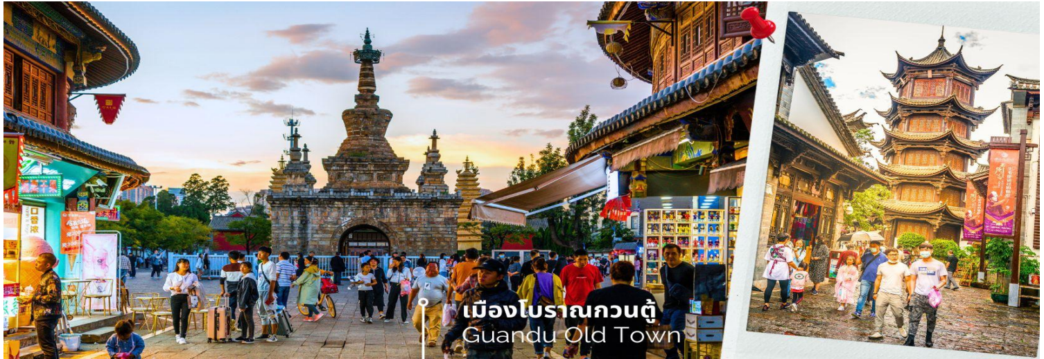
เมืองโบราณกวนตุ๋ Guandu Old Town

นำท่านชมบรรยากาศ เมืองโบราณกวนตุ๋ (Guandu Old Town) เป็นหนึ่งในต้นกำเนิดของวัฒนธรรมยูนนาน และยังถือเป็นหนึ่งในภูมิทัศน์ทางประวัติศาสตร์และวัฒนธรรม ที่สำคัญของเมืองคุนหมิง เมืองโบราณแห่งนี้ยังคงเป็นศูนย์กลางทางการค้าและคมนาคมที่สำคัญ ในอดีตเคยเป็นหมู่บ้านชาวประมงในสมัยราชวงศ์ถัง เมืองกวนตุ๋ยังเป็นเมืองแรกๆ ที่ศาสนาพุทธทางทิเบตได้เริ่มเผยแพร่เข้ามาในดินแดนยูนนาน