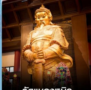
วัดแห่งกมวิ