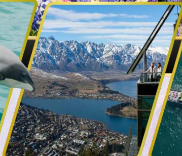
ยอดเขานีออนส์พีค