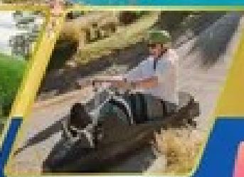
เล่นลuge ที่กรีนสทาวน์

บินภายใน (เที่ยวสุดคุ้ม) พักโรงแรม 4 ดาว ★★★★★