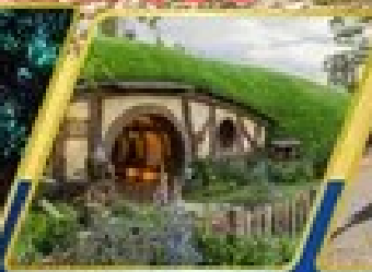
หมู่บ้านฮอบบิต