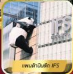
แพนด้าปาร์ค IFS