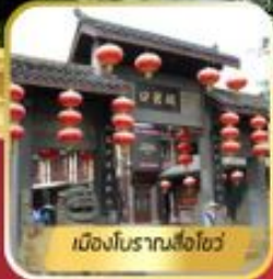
เมืองโบราณลือซื่อ