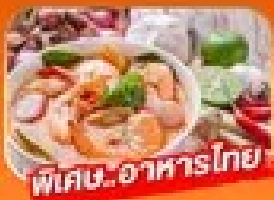
พิเศษ! อาหารไทย