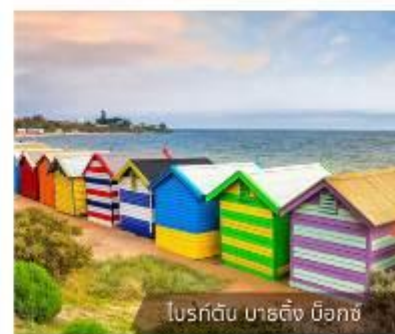
โบสถ์ต้น บาตัง มือกซ์