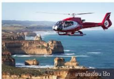
เที่ยวไฮเซ็น ไรด์