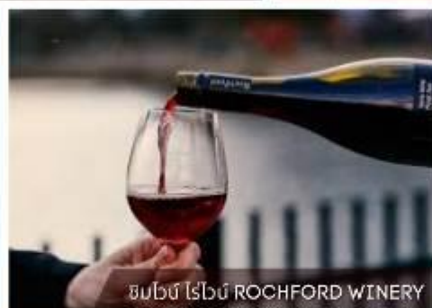
ชิมไวน์ ไวน์ ROCHFORD WINERY