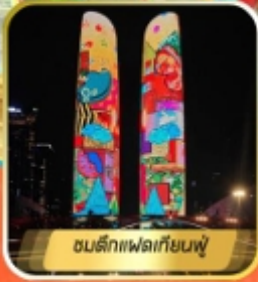
ชนตึกแฟลตเทียนฟู