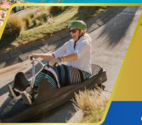
เล่นลู่ ที่ควีนส์ทาวน์

✈️ บินภายใน (เที่ยวสุดคุ้ม) พักโรงแรม 4 ดาว ★★★★★