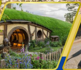
หมู่บ้านฮ็อบบิต