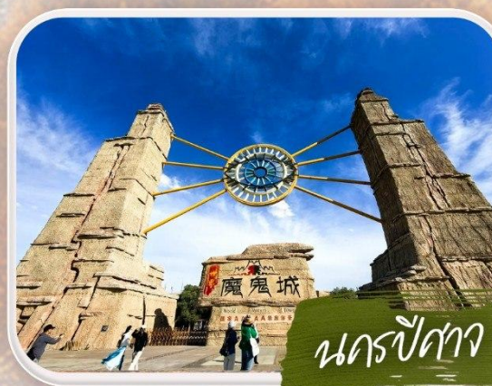
นครปีศาจ