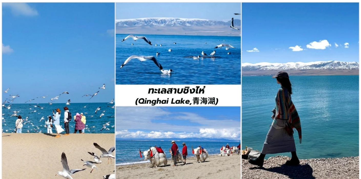
ทะเลสาบชิงไห่ (Qinghai Lake, 青海湖)

นำท่านเดินทางสู่ ทะเลสาบชิงไห่ ใช้เวลาเดินทางประมาณ 2 ชั่วโมง จากนั้นนำท่านชม ทะเลสาบชิงไห่ (Qinghai Lake, 青海湖) ที่ขึ้นชื่อว่าเป็นทะเลสาบน้ำเค็มที่ใหญ่ที่สุดในประเทศจีนและยังใหญ่เป็นอันดับต้นๆของเอเชีย โดยมีพื้นที่ประมาณ 4,657 ตารางกิโลเมตร ตั้งอยู่บนที่ราบสูงชิงไห่-ทิเบตที่มีความสูงเหนือระดับน้ำทะเลประมาณ 3,196-3,200 เมตร ที่ตั้งของทะเลสาบแห่งนี้ได้ถูกรายล้อมไปด้วยเทือกเขาทั้งหมด 4 ลูกด้วยกัน ได้แก่ เทือกเขาตังก Datong Mountain อยู่ทางทิศเหนือ, เทือกเขารี่เยว่ Riyue Mountain อยู่ทางทิศตะวันออก, เทือกเขาชิงไห่หนานซาน Qinghai Nanshan Mountain อยู่ทางทิศใต้, เทือกเขาเซียงฝี่ Xiangpi Mountain อยู่ทางทิศตะวันตก ชาวมองโกลเรียกทะเลสาบแห่งนี้ว่า คุกุ นอร์ (Kökö Noor) ชาวทิเบตเรียกทะเลสาบแห่งนี้ว่า โซ กอนโป (Tso Ngonpo) แต่ทั้งสองชื่อเรียกนี้ต่างก็มีความหมายว่า ทะเลสาบสีฟ้า แดงที่นี้ยังถือเป็นสถานที่ศักดิ์สิทธิ์ในพระพุทธ