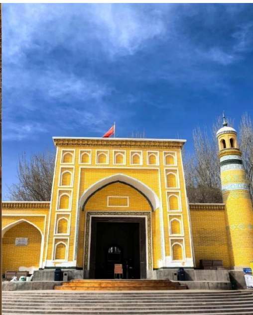
มัสยิดอิคกาห์ (Id Kah Mosque)