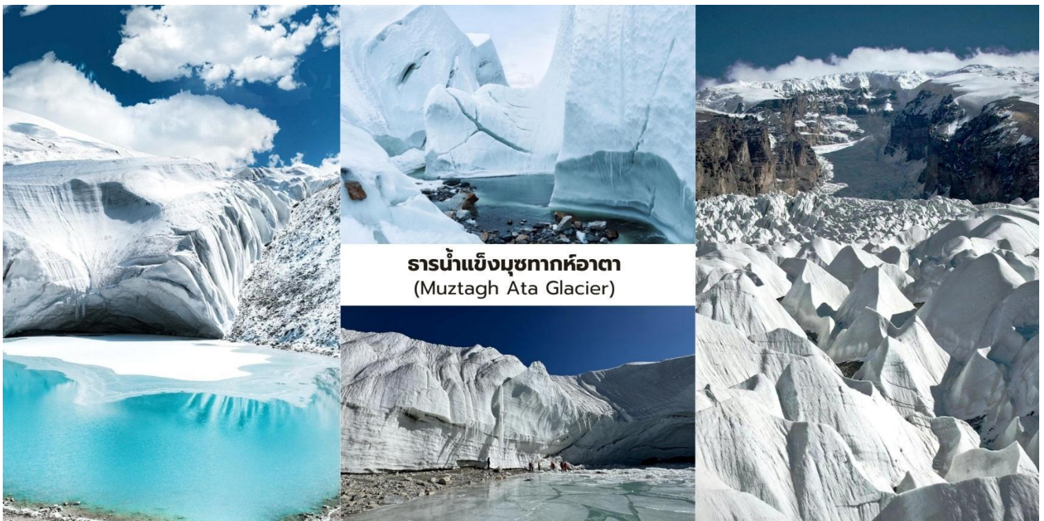
ธารน้ำแข็ง मुखทากหืออาตา (Muztagh Ata Glacier)

จากนั้นนำท่านเดินทางต่อสู่ เมืองทาชเคอร์กัน (Tashkurgan) ระยะทางจาก मुखทากหืออาตาประมาณ 50 กิโลเมตร ใช้เวลาเดินทางราว 1 ชั่วโมง อำเภอทาชเคอร์กันเป็นเมืองชายแดนที่ตั้งอยู่บนความสูงประมาณ 3,000 กว่าเมตรเหนือระดับน้ำทะเล ซึ่งเป็นเขตปกครองตนเองของชนเผ่าทาจิกและมีชาวทาจิกอาศัยอยู่เป็นประชากรส่วนใหญ่ของพื้นที่เมืองแห่งนี้ ด้วยความที่ตั้งอยู่ใกล้ชายแดนปากีสถาน ทาจิกิสถานและอัฟกานิสถานทำให้มีความสำคัญทั้งในด้านภูมิศาสตร์และวัฒนธรรมในอดีตพื้นที่แห่งนี้เคยเป็น จุดยุทธศาสตร์สำคัญบนเส้นทางสายไหม (Silk Road) ซึ่งใช้เป็นเส้นทางผ่านของพ่อค้าและนักเดินทางระหว่างจีนกับเอเชียกลาง ปัจจุบันแม้จะเป็นเมืองที่มีขนาดเล็ก แต่ก็ยังคงรักษาวัฒนธรรม วิถีชีวิตและเอกลักษณ์ของชนเผ่าทาจิกท่ามกลางภูมิประเทศของที่ราบสูงปามีร์ที่งดงามและเจียบสงบ เมืองทาชเคอร์กันจึงถือเป็นหนึ่งในเมืองชายแดนที่มีเอกลักษณ์ทางชาติพันธุ์และประวัติศาสตร์บนเส้นทางสายไหมที่สะท้อนถึงการผสมผสานของวัฒนธรรมจีนและเอเชียกลางได้อย่างน่าสนใจ.