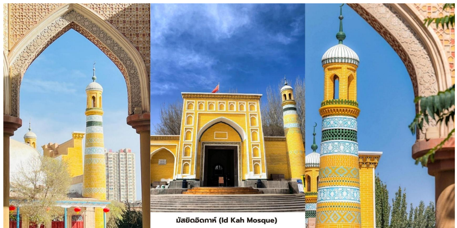
มัสยิดอิคคาห์ (Id Kah Mosque)

สมควรแก่เวลานำท่านเดินทางสู่ สนามบินคัชการ์ (Kashgar Airport) บินภายในประเทศกลับสู่ ซีหนิง