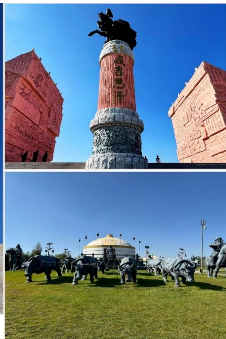
เขตท่องเที่ยวเจงกิสข่าน • กลุ่มประติมากรรม กองทัพเหล็กและกระโจมทอง