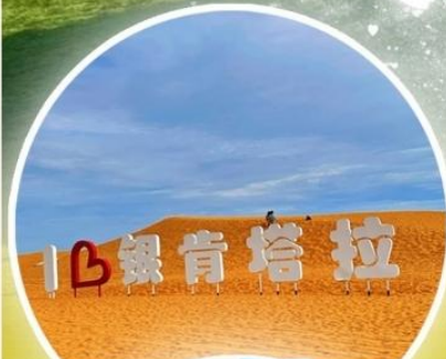
ทะเลทรายอินเคินทาลา