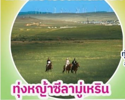
ทุ่งหญ้าซิลามูเหริน