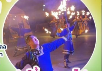
ปาร์ตี้รอบกองไฟ