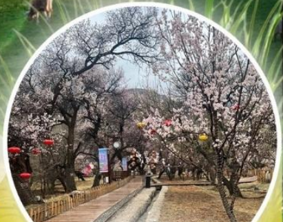
หุบเขาดอกแอปเปิ้ล

ทุ่งหญ้าซิลามูเหริน - พิธีการขอพรจากไอวเฮา - ปาร์ตี้กองไฟ - หมู่บ้านชนเผ่ามองโก สวนวัฒนธรรมมองโกเลียเหมิงเสียง - หุบเขาดอกแอปเปิ้ล - ทะเลทรายอินเคินทาลา แหล่งวัฒนธรรมมองโกเลียหยวนหลิว (รวมรถกอล์ฟ 2 ขา) - ตลาดกลางคืนเจียไต้ สวนวัฒนธรรมการแต่งงานสุดเอ็กซ์คลูซีฟแห่งเดียวในประเทศจีน บ้านองค์ปฐม - เซตการท่องเที่ยวเจงกิสข่าน-ถนนคนเดินคังปาซือ