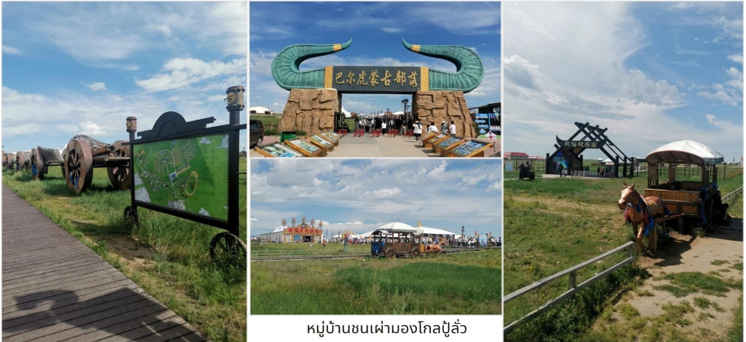
หมู่บ้านชนเผ่ามองโกลปู๊ ล้ว

นำท่านชม หมู่บ้านชนเผ่ามองโกลปู๊ ล้ว (蒙古部落 - Mongol Buluo) ชนเผ่าเร่ร่อนมองโกเลียสืบทอดวิถีชีวิตแบบดั้งเดิมมาหลายพันปี พวกเขาจะย้ายถิ่นฐานตามฤดูกาล และเลี้ยงสัตว์เป็นอาชีพหลัก (ม้า แกะ แพะ วัว และอูฐ) ใช้ชีวิตโดยการพึ่งพาธรรมชาติ ในฤดูใบไม้ร่วงระหว่างเดือนกันยายนถึงพฤศจิกายน พวกเขาจะย้ายลงมาสู่พื้นที่ที่มีที่กำบังลม เตรียมอาหารสำรองสำหรับฤดูหนาว และซ่อมแซมเกออร์รวมถึงอุปกรณ์ต่างๆ เมื่อเข้าสู่ฤดูหนาวในช่วงเดือนธันวาคมถึงกุมภาพันธ์ ชาวมองโกเลียจะตั้งถิ่นฐานในหุบเขาที่มีที่กำบัง ใช้เวลาในการดูแลสัตว์อย่างใกล้ชิดและทำงานหัตถกรรมในร่ม