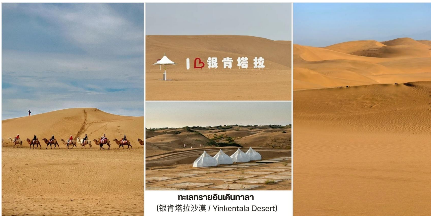
ทะเลทรายอินเคินทาลา (银肯塔拉沙漠 / Yinkentala Desert)

OPTION TOUR เลือกซื้อกิจกรรมสนุกสุดเหวี่ยงในทะเลทราย ราคา 380 หยวน ต่อท่าน