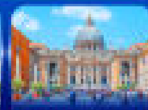
อังกฤษลอนดอน 1 คืน