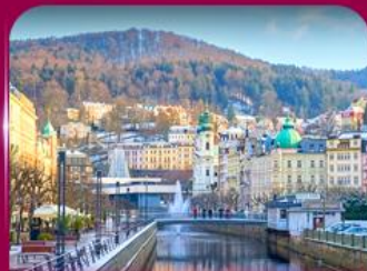
เมืองสปาแสนสวย คาร์โลวี วารี