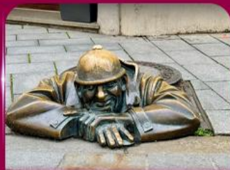
เซลฟี่คูคูมิลา บราติสลาวา