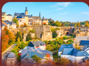
ย่านเมืองเก่า ลักเซมเบิร์ก