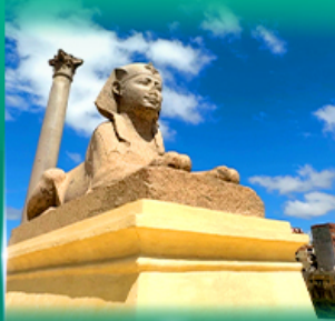
เสาริมันปอมเปย์