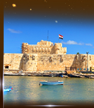
ป้อมปราการ Quite Bay