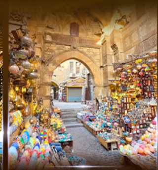
ตลาดฟานเอลคาลิ