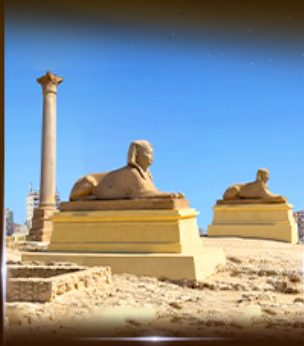
เสารัมปองเมย์