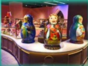
พิพิธภัณฑ์ ตุ๊กตาเป่ลือกต