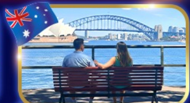
ชมวิวอ่าว สวนน้ำหินแบคควอริ