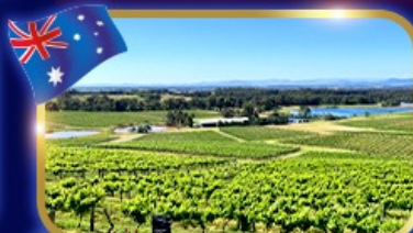
ชมไร่่อุ่น ไร่นมบ๊อว์ระดับโลก