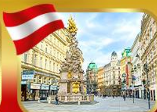
ช้อปปิ้งย่านคาร์ทเทินอร์สตรีก