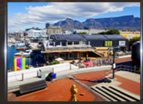
ท่าเรือ V&A waterfront