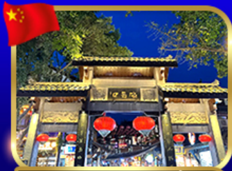
หมู่บ้านโบราณฉีโซ่ว