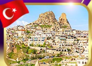
หุขซาอูซึซาร์ คัปปาโตคีย