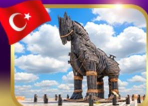
บั้บเมือกรอ ย ซานัคคาลั้