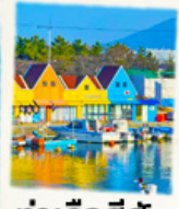
ท่าเรือสีสัน