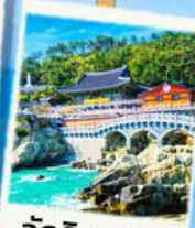
วัดริมทะเล