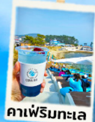
คาเฟ่ริมทะเล