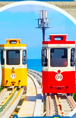
นั่งรถไฟปู๊กบีก

ราคานี้รวมค่าภาษีน้ำมัน + ค่าภาษีสนามบิน ** ปรับขึ้น ณ วันที่ 1 เม.ย. 69 เรียบร้อยแล้ว **