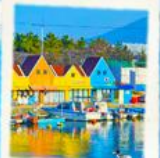
ท่าเรือสีสัน