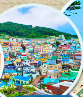
หมู่บ้านคัมซอน