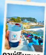
คาเฟ่ริมทะเล