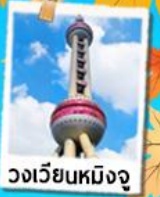
วงเวียนหมิงจู่