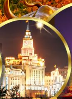
เดอะมันด์