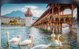
สะพานไม้ซาเปล