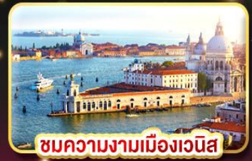
ชมความงามเมืองเวนิส