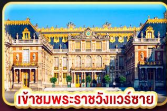
เข้าชมพระราชวังแวร์ซาย