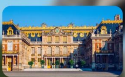
เข้าชมพระราชวังแวร์ซาย