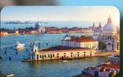
ชมความงามเมืองเวนิส