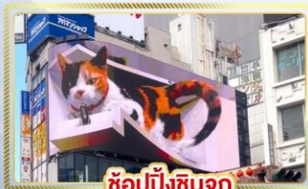
ซูปป์ชินจูกุ