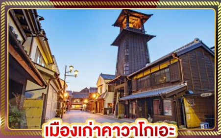
เมืองเก่าคาวาโกเอะ