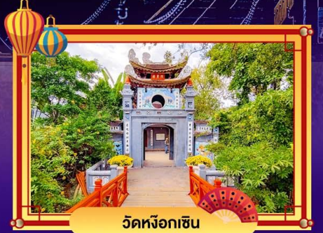
วัดหังอกเซิน