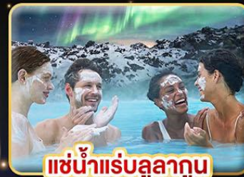
แช่น้ำแร่สุขภาพ