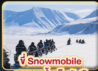
ขี่ Snowmobile บนธารน้ำแข็งพันปี