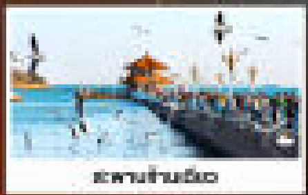
สะพานเทียนจิน