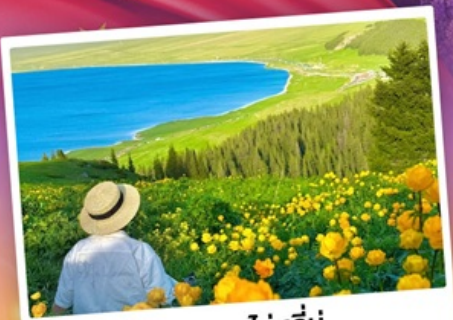
ทะเลสาบโซห์ลีมู่

ถ่ายรูปทุ่งดอกลาเวนเดอร์ - กุ้งหญาคาลาจัน ★ SKY GRASSLAND กุ้งหญาบรคโลก