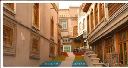
เมืองเก่าคัชการ