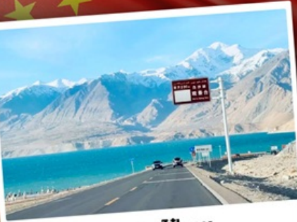
ทะเลสาบไปซาทุ

“ซินเจียงใต้” ดินแดนแห่งทะเลทราย สัมผัสวัฒนธรรมของชาวซินเจียงอุยกูร์