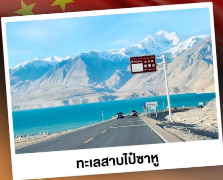
ทะเลสาบโป้ซาหู

“ซินเจียงใต้” ดินแดนแห่งทะเลทราย สัมผัสวัฒนธรรมของชาวซินเจียงอุยกูร์