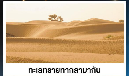
ทะเลทรายทากลามากัน