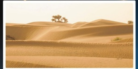
ทะเลทรายทากลามากัน