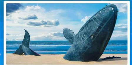
ชายหาดวาฬโดดเดี้ยว