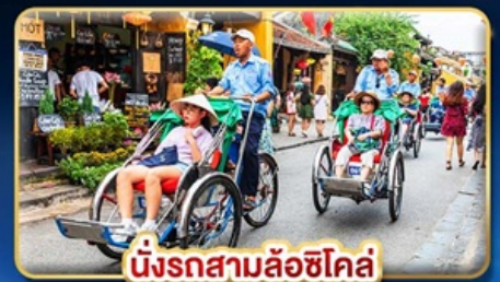
นั่งรถสามล้อฮิโคล