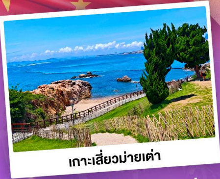
เกาะเสี่ยวมายเต่า