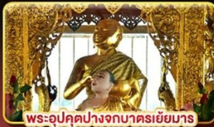
พระอุปคุตปางจกบาตรเยี่ยมมา