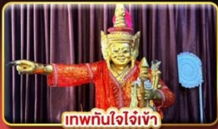
เทพทันใจใจเจ้า