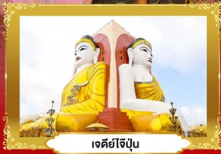
เจดีย์ไข่มุก