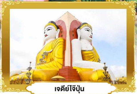
เจดีย์ไจ้ปูน