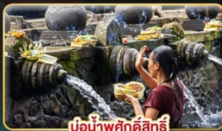
บ่อน้ำพุศักดิ์สิทธิ์