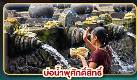
บ่อน้ำพุศักดิ์สิทธิ์