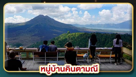
หมู่บ้านคินตามณี