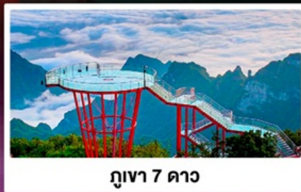
กูเงา 7 ดาว