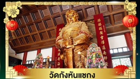
วัดกั๊กหันแซง