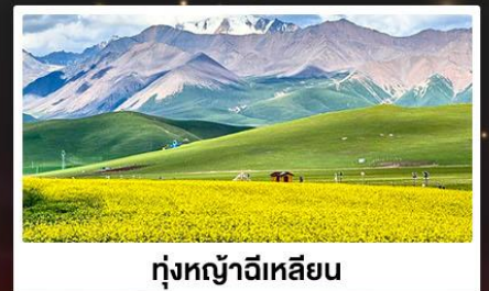
ทุ่งหญ้าจีเหลียน