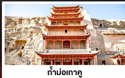
ถ้ำม่อเกาถู