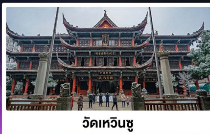
วัดเหวินซู