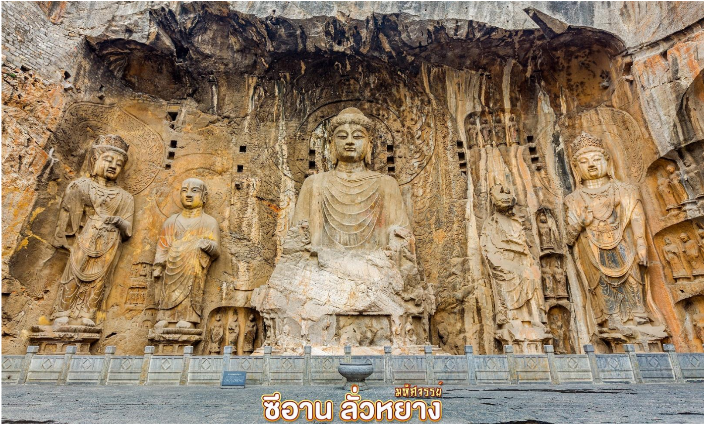
มณฑลเหอหนาน ซีอาน ลั่วหยาง

ตรงไหนดวงตานั้นก็ยังคงมองเห็นอยู่ ซึ่งพระประธานองค์นี้เชื่อว่าแกะสลักเป็นรูปพระพักตร์ของ ‘พระนางบูเช็กเทียน’ จักรพรรดินี (ฮ่องเต้หญิง) องค์แรกและองค์เดียวที่ได้รับการบันทึกไว้ในประวัติศาสตร์จีน